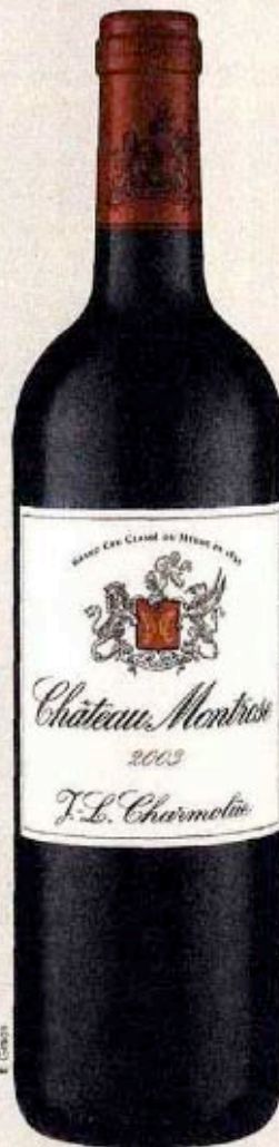
CHATEAU MONTROSE. L'une des rares stars du millésime 2003

Bref, dix ans après, 2003 ne réserve pas que de bonnes surprises. O. P.