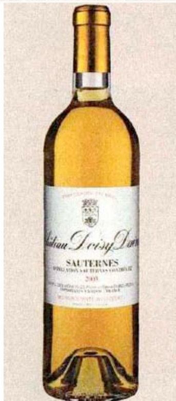
CHÂTEAU DOISY DAËNE Ce sauternes majestueux d'élégance prend la tête de la dégustation.

La bouche s'ouvre sur une belle expression, mais l'amertume reprend le dessus en finale.